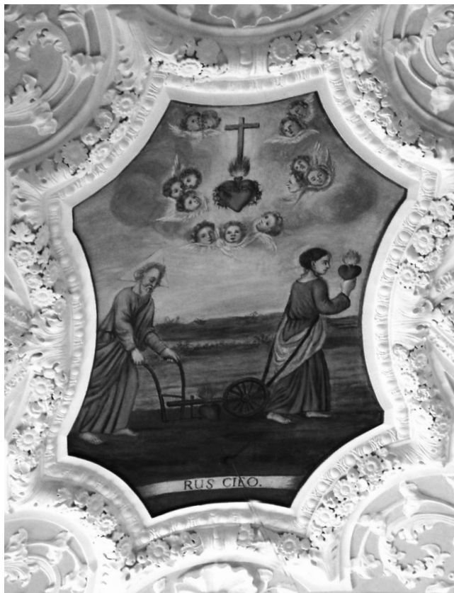
Erläuterungstext zum Bild: Maria-Ward-Kapelle Mindelheim: Gottvater am Pflug, die Schare ist das Herz Jesu. Deshalb sind die Buchstaben COR IESU (= Herz Jesu) zu RUS CIEO (= ich pflüge das Feld) umgruppiert.

So dürfen wir nach Worten von Jörg Zink beten: „Jede Stunde des neuen Jahres ist wie ein Streifen Land. Ich möchte ihn aufreißen mit dem Pflug. Ich möchte Liebe hineinwerfen, Gedanken und Gespräche, damit Frucht wächst. Segne du mein neues Jahr, das genauso das deine ist. Amen“